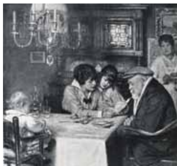
Lettres du front (1915).

Lectures de textes de féministes françaises de la période 1910-1920. Échanges et débat.